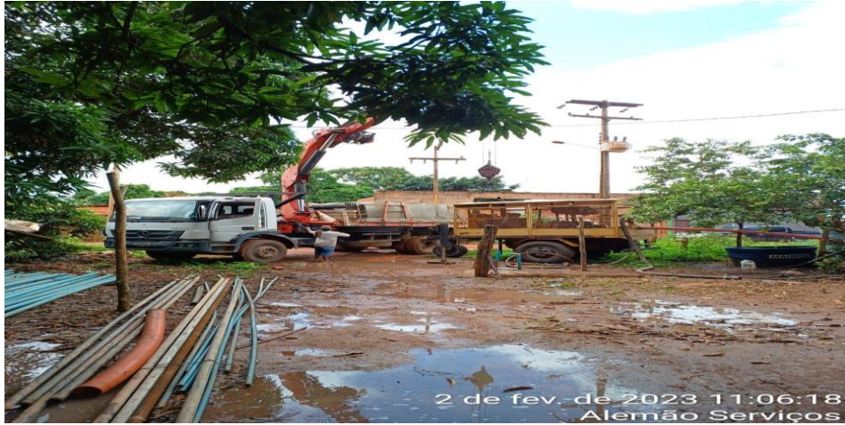
Técnicos realizando vistoria e manutenção em um dos poços